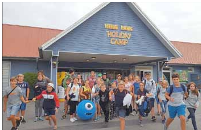
Abfahrt am Sonntag, Ansturm auf die besten Plätze im Bus