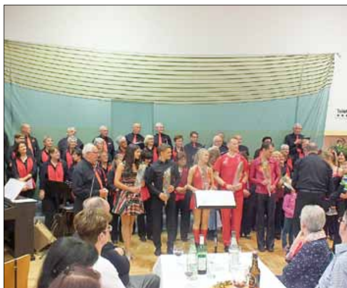
Tänzer und Sänger beim Weinfest 2017

Lassen Sie sich überraschen und seien sie gespannt auf die dritte Ausgabe des Weinfestes!