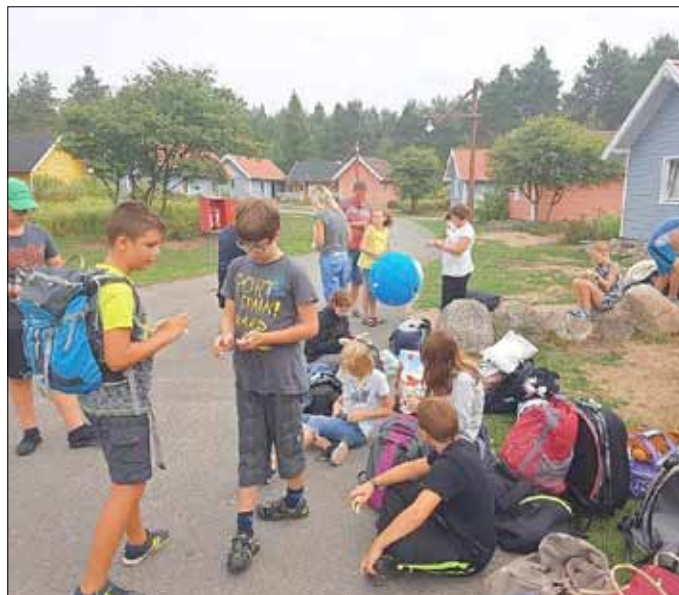
Vor den Unterkünften im Bungalowdorf „Holidaycamp“