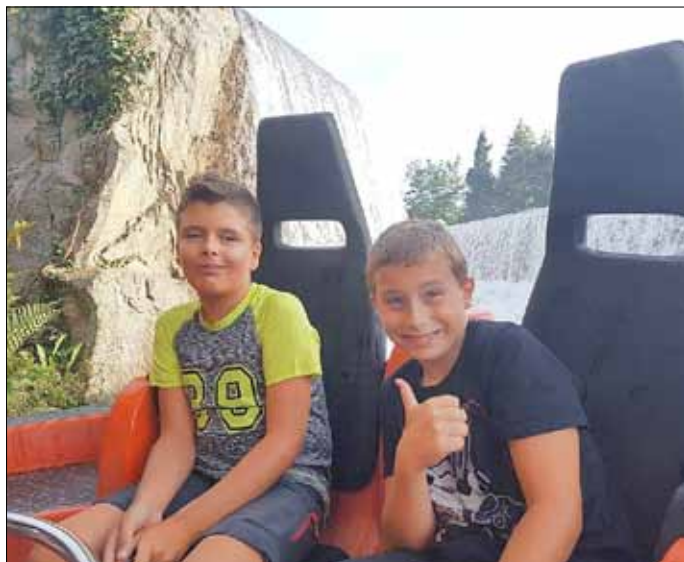
Wildwasserbahn mit Wasserfall im Heidepark