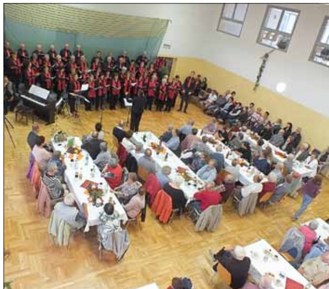
Die gut besuchte kleine Geratalhalle am 24.09.2017