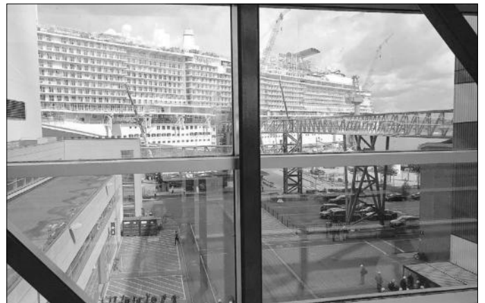
Im Werksgelände der Meyer-Werft