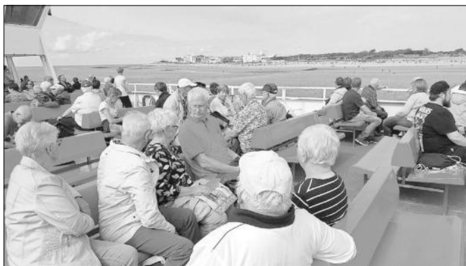
Vor der Insel Norderney

östlichen, weitgehend naturbelassenen Inselbereich, der geprägt ist von mit Strandhafer bewachsenen Dünenhügeln. Hier und da ein Hof, ein Golfhotel oder ein Ferienlager aus alter oder neuer Zeit. Einen Stopp gab es an der Weißen Düne mit erhabenem Ausblick über Insel und Wattenmeer und natürlich die weite Nordsee.