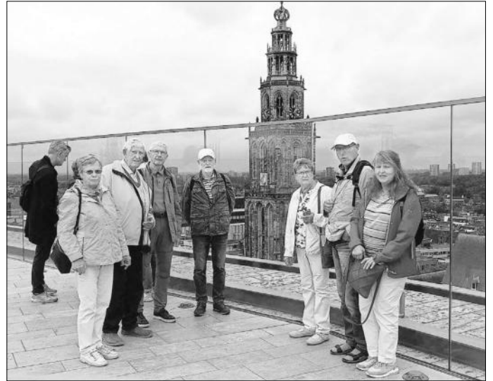
Auf dem „Groningen-Forum“ - über den Dächern der Stadt