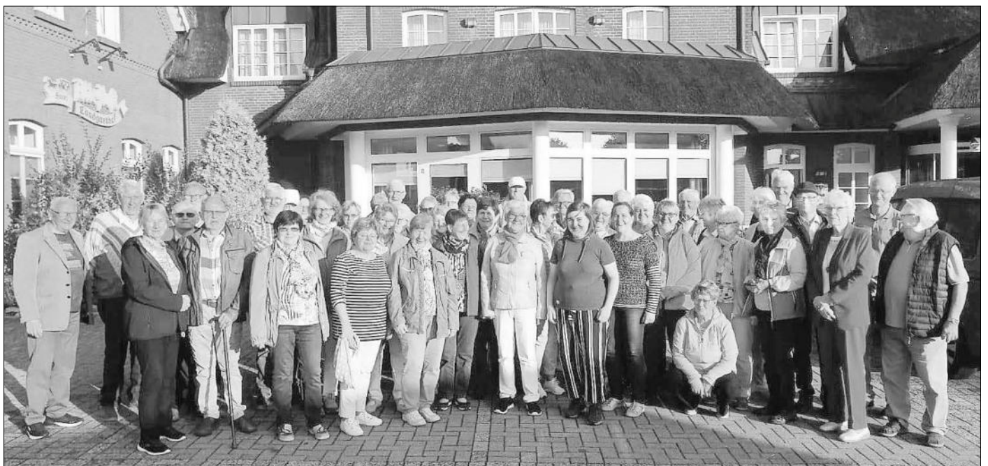
Die Sängertouristen vor dem „Landgasthof zur Post“