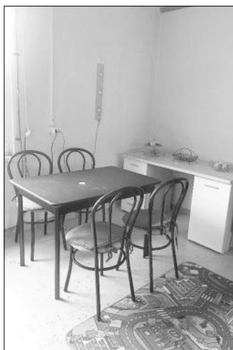
Tisch und Stühle