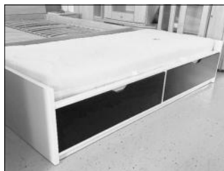
Bett mit Matratze mit Stauraum