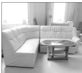
Leder couch mit Schlaffunktion