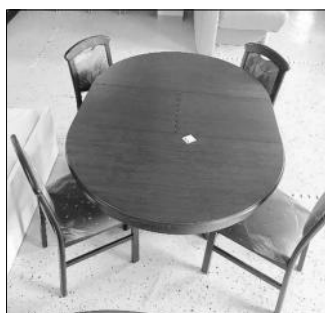
Tisch + 4 Stühle