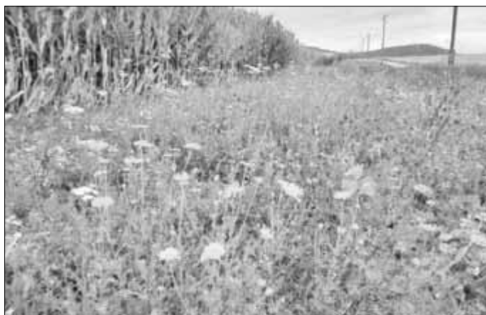
Neu angelegter Feldrain am Ilm-Radwanderweg bei Kleinhettstedt.

Im Zuge des Insektenschutzprojektes „VIA Natura 2000“ wurden im Jahr 2021 in der Nähe der Orte Kleinhettstedt, Rockhausen, Holzhausen und Bittstädt insgesamt vier Feldraine im Ilmkreis mit einer Gesamtfläche von ca. 1,5 Hektar neu angelegt. Hierfür wurde auf kommunalen Wegparzellen sowie auf oder an Ackerflächen eine Mischung von einheimischen Wildblumen und Gräsern streifenförmig ausgebracht. Damit sind dauerhafte und ganzjährige Nahrungsquellen sowie Rückzugs- und Fortpflanzungslebensräume für Insekten neu geschaffen worden, die in unserer Kulturlandschaft selten geworden sind. Von diesen neuen Biotopen profitieren auch andere Tiergruppen: beispielsweise Feldhase, Zauneidechse, Goldammer, Rebhuhn oder Wachtel. Für andere Arten sind solche Verbindungsbiotope in der weitläufigen Agrarlandlandschaft notwendige Brücken, um zwischen anderen Kleinbiotopen oder Schutzgebieten wandern zu können. Damit leisten neue Feldraine einen wichtigen Beitrag, dem auf fallenden Artenrückgang entgegenzutreten.