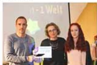
Preisverleihung Thüringer Energie AG