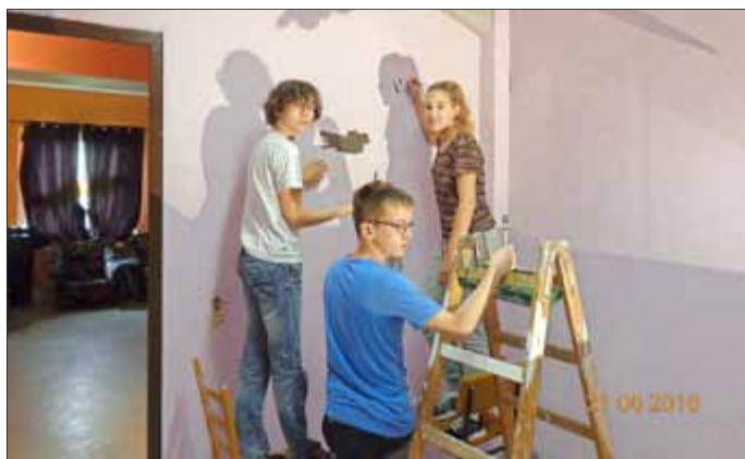
Nachdem man die Wände gestrichen hatte, wurden Schattenbilder aufgemalt