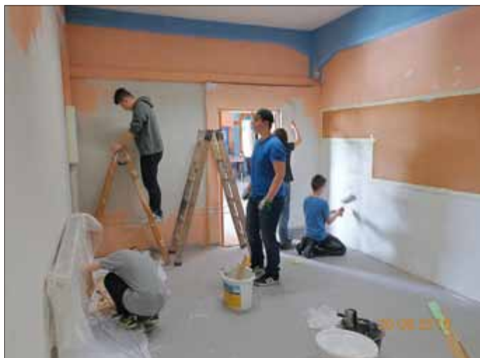
Im Rahmen der „Anderswoche“ der Regelschule bekam ein Raum im Jugendzentrum neue Farben

Genauere Informationen beim Jugendpfleger Steffen Fischer unter der Tel. 03677 469279 oder 0160 8000575.