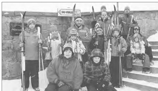
Tourismus Agentur Geratal