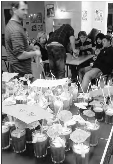
Über hundert alkoholfreie Cocktails wurden gemixt und natürlich auch getrunken