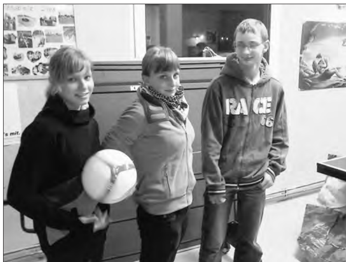
3 Jugendliche aus dem Siegerteam nahmen die Preise (Tischtennisplatte, Fußball) in Empfang