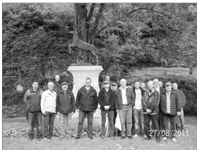
Gruppenbild vor dem Jägerdenkmal neben dem Stollenausgang.