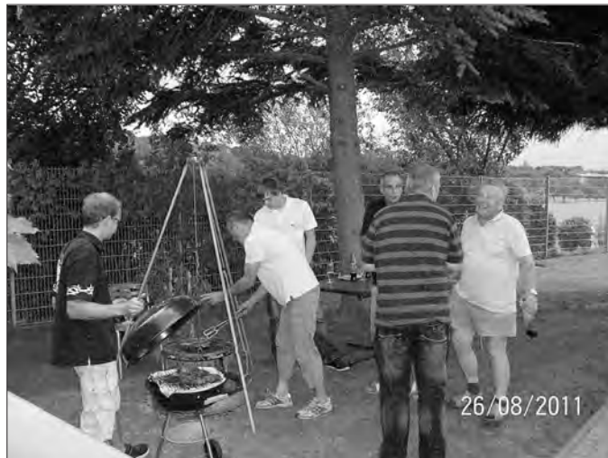
Grillabend auf der Kläranlage.