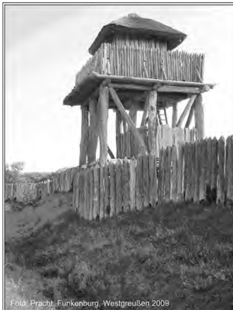
Funkenburg, Westgreußen 2009