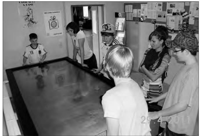
Spannung beim Airhockey-Turnier, jeder fieberte mit