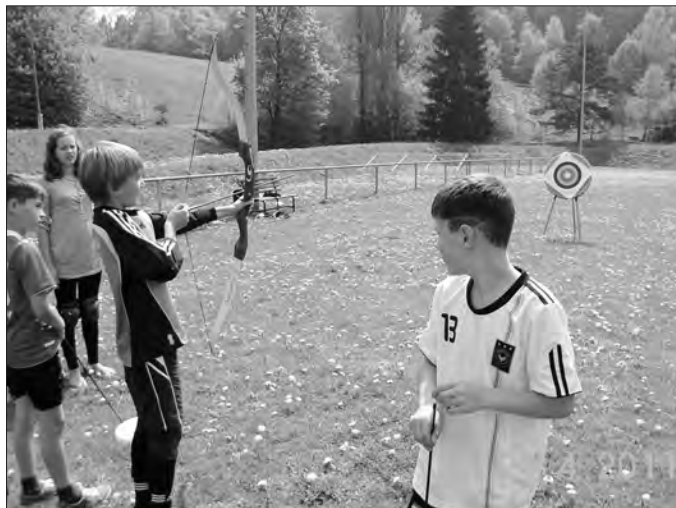
Beim Bogenschießen war das Ziel gar nicht so einfach zu treffen, wie es aussieht