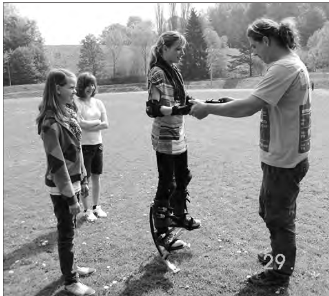
Großen Spaß hatte man mit den Powerricern