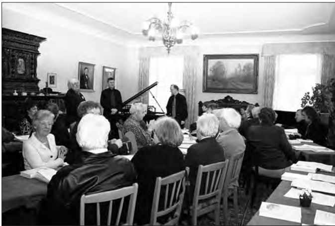
Beim Konzert im Salon des Weingutes CARL-KOCH-ERBEN in Oppenheim