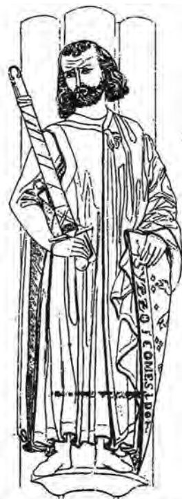
Graf Sizzo I. von Kevernburg.

frauengruppe-geratal@gmx.de Tel./Fax: 36 77 / 79 64 03